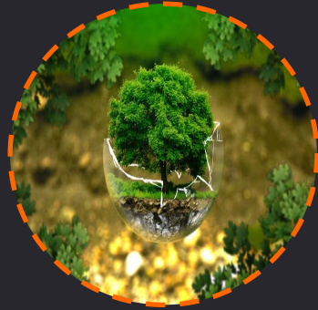
Cleantech y Energía