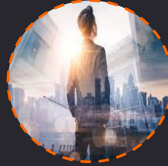
Taller de Future Thinking