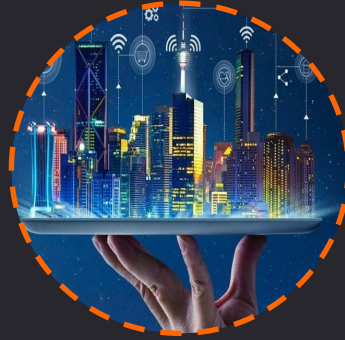
Transporte y Smart Cities