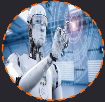
Robótica y Automatización